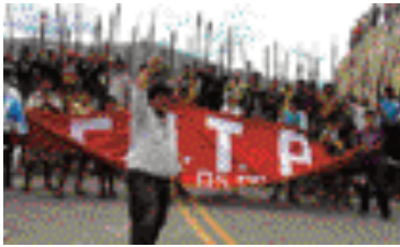
Bagua topluluk üyeleri yerli halkların toprak haklarının korunması için gösteri yapıyor, Peru

Bu örneğin amacı, tehditkar bir durumdan kaçmak için mükemmel bir plan sunmak değil. Tamamen anlatılan bağlama özel bir örnek olarak, Risk Denklemine çeşitli bileşenlerini tespit etmeniz ve risk düzeyini değerlendirmek için bunları nasıl kullanılabileceğinizi anlayabilmeniz için kullanıldı.