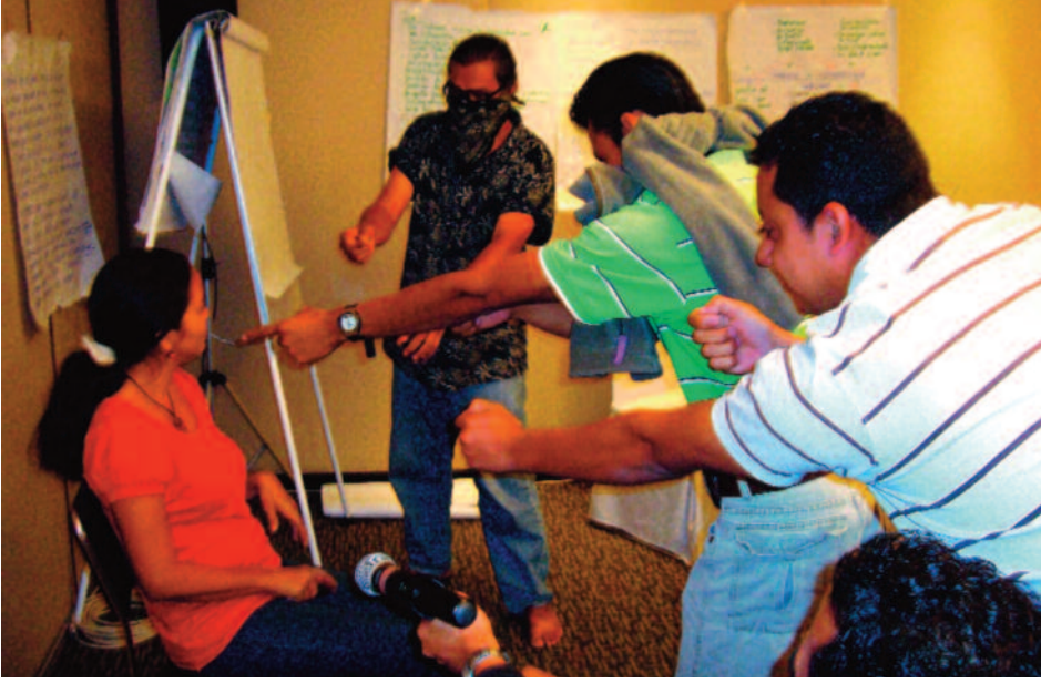
Güvenlik planının nasıl işleyeceğini gösteren, silahlı erkeklerin bir kadın hak savunucusuna saldırdığı bir canlandırma