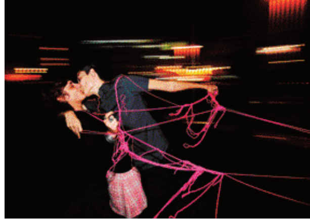
Majda Puaca (sağda) Queer Belgrad etkinliği sırasında saldırıya uğrayan lezbiyen grubundaydı. Saldıran çetenin liderlerine dava açtı.

Güvenliğinizi artırmak için yapmanız gereken en önemli iş, riskleri, etkilerini ve gerçekleşme olasılıklarını doğru belirlemek. Ancak, bu değerlendirme eylemle desteklenmeli – riskin meydana gelme olasılığını azaltmak için tedbirler almalı (Eylem Planı) ve en kötü ihtimal gerçekleştiğinde yapılması gerekenlere dair bir plan oluşturulmalı (Acil Durum Planı). Eylem Planları ve Acil Durum Planları 5. Bölüm'de ele alınacak. Bunları tamamlamadan önce, Risk Denklemimin ikinci unsuruna, yani Tehditler başlığına bakacağız.