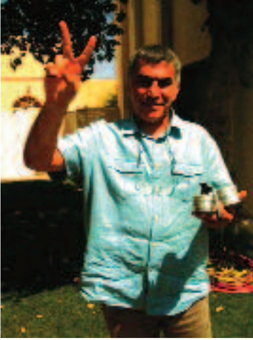
Nabeel Rajab, Bahreyn – evine atılan biber gazı fişekleriyle